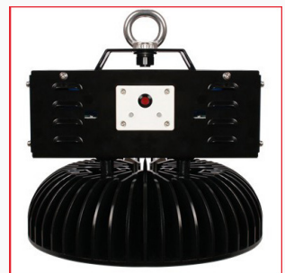
Optional: Notlichtfunktion 1.5h bei 10% resp. 3h. bei 5% Wattleistung Lithium Akku 8800 mAh.