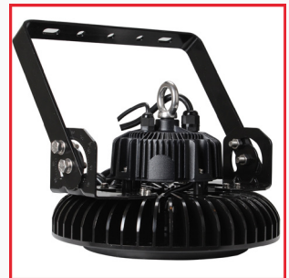
Optional: Fixierung der Leuchte durch eine Stahlklammer.