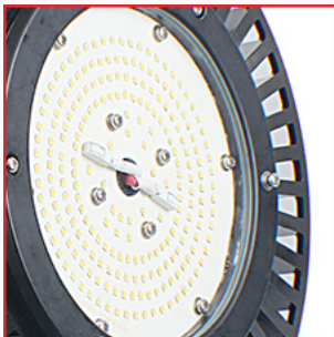
Linse mit einem Abstrahlwinkel von 120°.