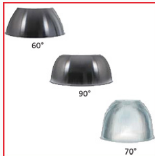
Optional: Reflektoren mit Abstrahlwinkel von 60°, 70°, 90°.