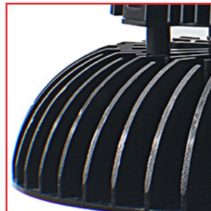
Kaltschmiedekühlkörper aus 1070 reinem Aluminiumdruckguss. Keine Verrostung möglich.