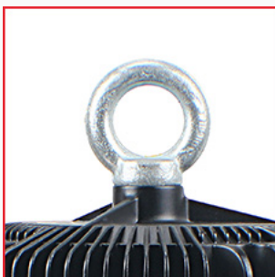
Einfache Fixierung der Leuchte durch einen Stahlhaken.